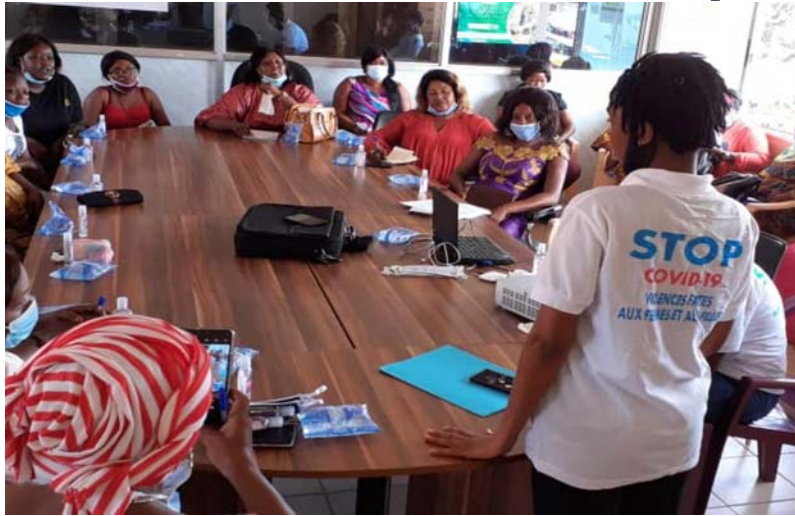
Une vue des femmes en discussion

Afin de minimiser les effets négatifs potentiels, tout en répondant aux attentes des parties prenantes du projet, il a été requis l'élaboration d'un plan de prévention et d'atténuation des risques de VBG, d'Exploitation et aux Abus Sexuels et Harcèlement Sexuel (PG VBG-EAS-HS). Selon le gouvernement, ce plan contribuera à l'accroissement de la mobilisation sociale et communautaire, afin d'amener les populations à connaître et à respecter les droits des femmes et à lutter contre les