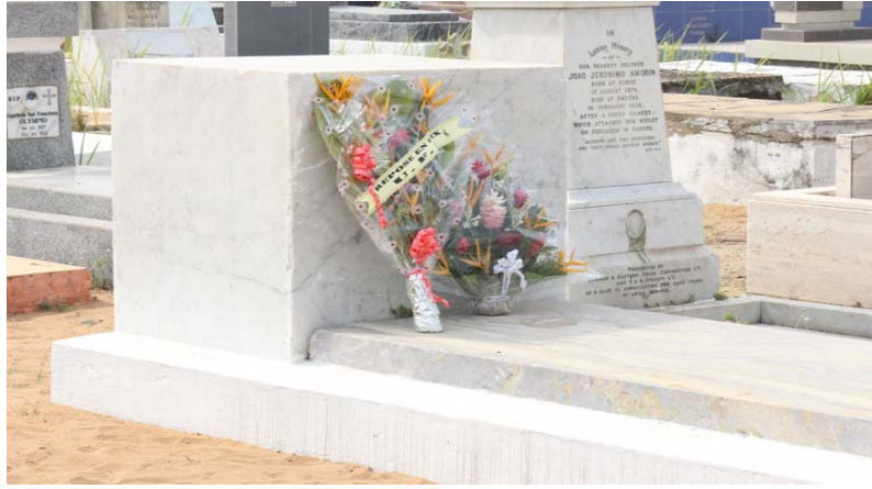
La tombe du premier président du Togo, Sylvanus Olympio

En effet, l'équipe qui a fait le déplacement est arrivée aux alentours de 15h GMT au cimetière catholique d'Agouè. Le premier constat, est que la tombe de l'illustre disparu est propre et ne présente aucune inscription.