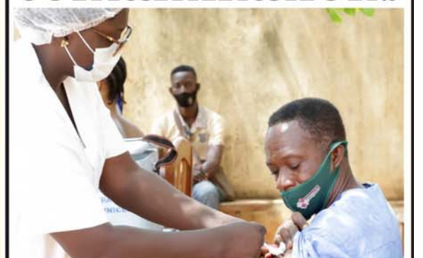
Les contaminations maîtrisées grâce à la vaccination et aux mesures barrières.

EmploiTogo.com Des annonces, des offres d'emploi, une banque de Cvs, des formations. Journalemploi.com Tel 22 20 05 53