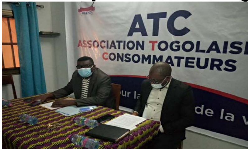
La table d'honneur

Il s'agit notamment du renforcement de contrôle de prix sur toute l'étendue du territoire ; le plafonnement de la caution et de la garantie de loyer dans la ville de Lomé à 3 mois de loyers comme caution et 3 mois de loyers comme garantie ; l'octroi d'une avance d'un mois de salaire aux fonctionnaires des secteurs publics et parapublics et aux retraités qui sera remboursable par tranches mensuelles jusqu'à décembre 2022 ; le paiement des indemnités de départ à la retraite à partir de 2020, équivalent à 3 mois de salaires à partir de janvier 2022.