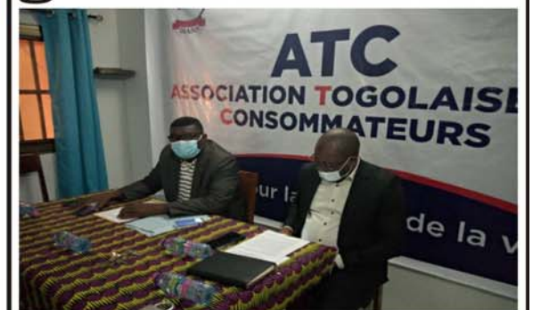
La table d'honneur