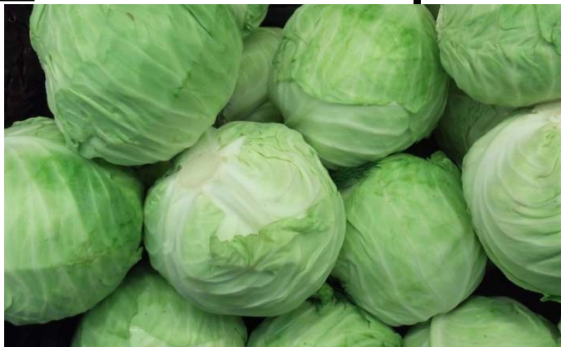
Chou vert, plus forte hausse avec +25,8% et "Autre type de transport de passagers et autre service de transport" (-1,7%).

Au chapitre des contributions négatives, les postes qui ont contribué à la baisse des indices des fonctions de consommation "Santé" et "Transports" sont : "Médicaments traditionnels" (-2,5%) ; "Médicaments modernes" (-0,1%)