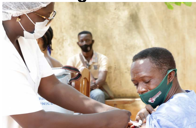
Une situation maîtrisée grâce à la vaccination et à l'observation des mesures barrières

Au 15 Janvier, cent-quatre-vingt-six (186) des 1711 personnes testées sont positives, portant le nombre total de cas positifs à 35851. Ces 186 personnes, dont les âges sont compris entre 0 et 81 ans, se répartissent comme suit : quarante (40) cas parmi les contacts : 2 femmes et 4 hommes dans la préfecture d'Agoè, 10 femmes et 12 hommes dans la préfecture du Golfe, 1 homme dans la préfecture de Yoto, 1 femme dans la préfecture de Zio, 2 femmes et 3 hommes dans la préfecture de Kloto, 3 femmes et 1 homme dans la préfecture de